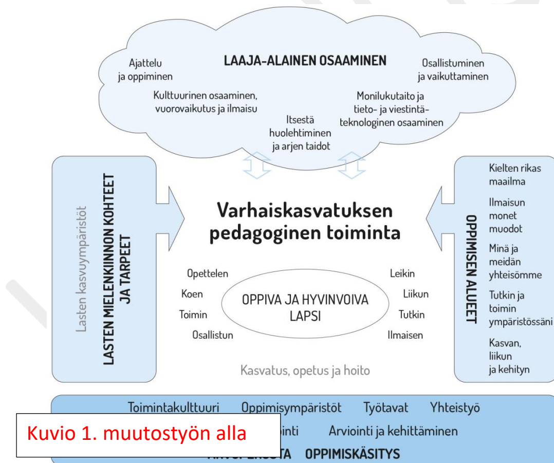
Kuvio 1. muutostyön alla

Varhaiskasvatuksen pedagogista toimintaa ja sen toteuttamista kuvaa kokonaisvaltaisuus. Tavoitteena on edistää lasten oppimista ja hyvinvointia sekä laaja-alaista osaamista (kuvio 1). Pedagoginen toiminta toteutuu lasten ja henkilöstön välisessä vuorovaikutuksessa ja yhteisessä toiminnassa. Lasten omaehtoinen, henkilöstön ja lasten yhdessä ideoima sekä henkilöstön johdolla suunniteltu toiminta täydentävät toisiaan. Varhaiskasvatuksen pedagoginen toiminta läpäisee kasvatuksen, opetuksen ja hoidon kokonaisuuden.