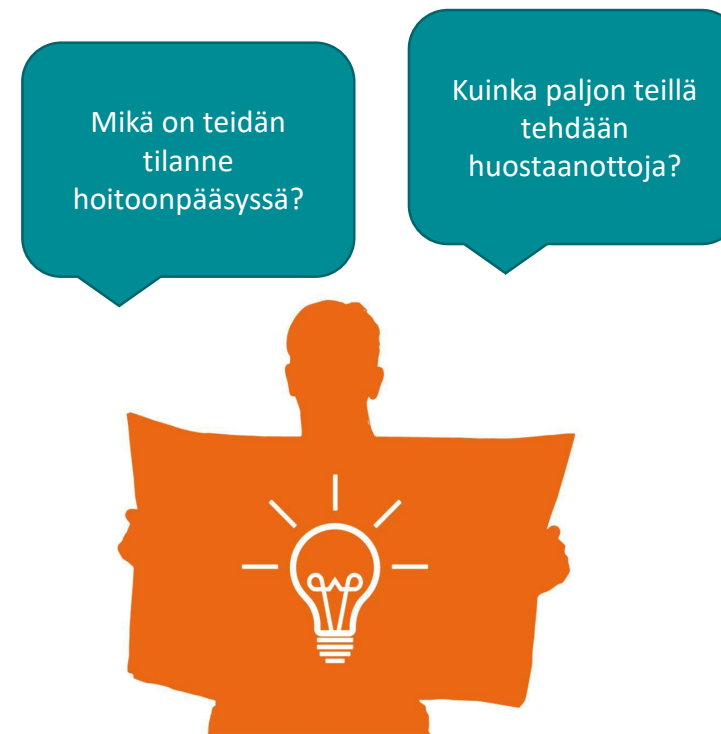
Hyvinvointialueen B johtaja