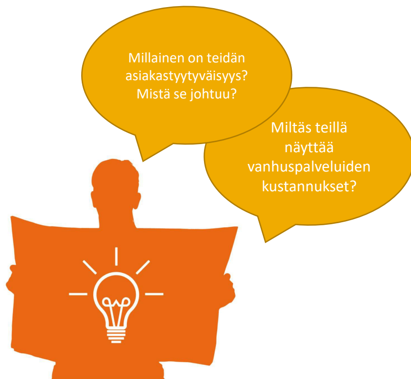
Hyvinvointialueen A johtaja