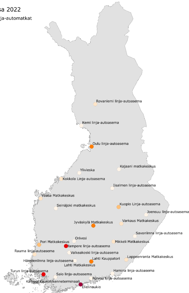
Kuva 2. Liikennemalliin perustuva arvio pitkämatkaisten (yli 100 km) linja-autoliikenteen matkojen nousujen määrästä vuorokaudessa vuonna 2022.