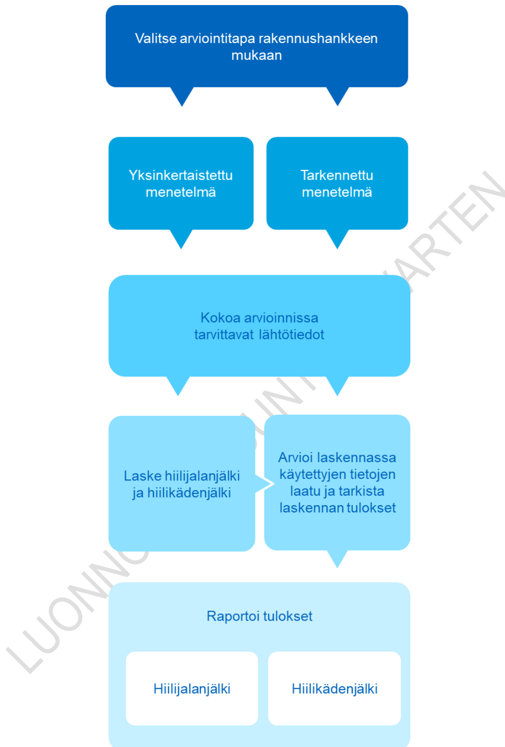
Kuva 1. Rakennuksen hiilijalanjäljen ja hiilikädenjäljen arvioinnin vaiheet.