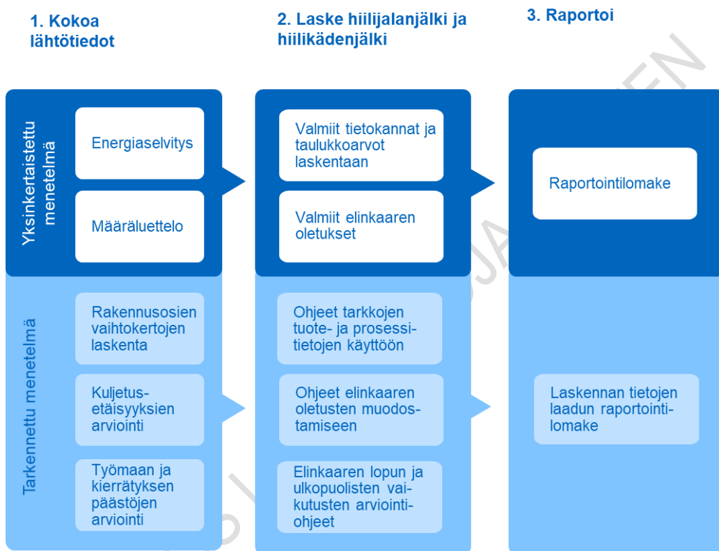
Kuva 5. Arvioinnin vaiheet.

Tarkennettua menetelmää voidaan soveltaa myös siten, että osa elinkaaren vaikutuksista lasketaan tarkennetun ja osa yksinkertaistetun menetelmän mukaan. Tällöin on ilmoitettava, mitä laskentatapaa on käytetty kussakin elinkaaren vaiheessa.