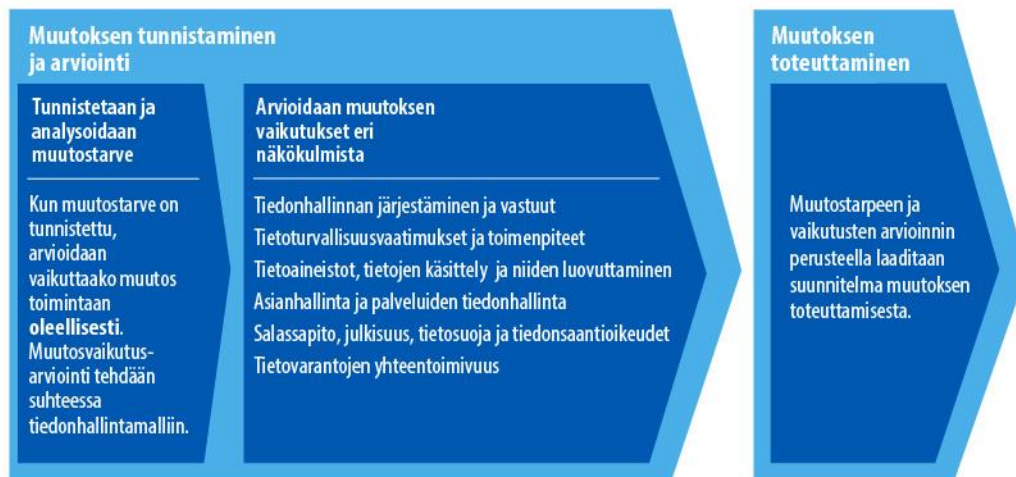
Kuva 3. Muutosvaikutusarvioinnin yleisprosessi.

Tiedonhallintalain tarkoittama tietojärjestelmä uudistuksen muutosvaikutusten arviointi on varhaisen suunnitteluvaiheen ehdotus eikä se korvaa käyttöönotettavaan toteutukseen mahdollisesti vaadittavia tietoturva-auditointeja.