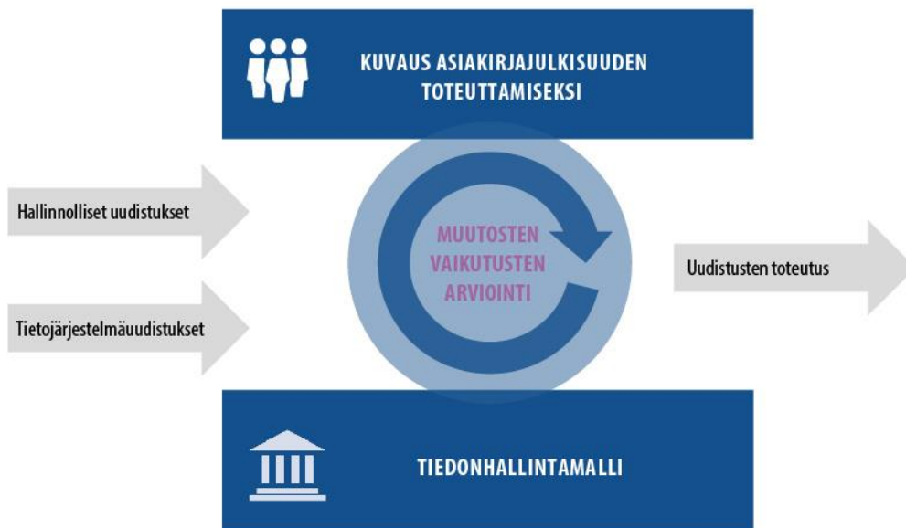
Kuva 2. Tiedonhallintamalli toimii nykytilan informaatiopohjana hallinnollisten ja tietojärjestelmä-uudistusten muutosvaikutuksia arvioitaessa.

tunnistaa, että teknisenkin uudistustarpeen taustalla on usein hallinnollinen ja toiminnallinen muutostarve, ja toisaalta hallinnolliseen uudistukseen voi sisältyä myös tekninen muutos.