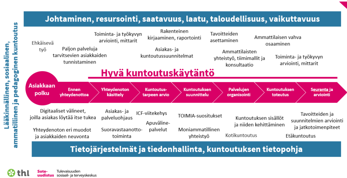
Kuva 1. Kuntoutuksen toimintamalli.

Kuntoutuksen yleinen toimintamalli (kuva 1.) voidaan kuvata monen eri osa-alueen muodostamana kokonaisuutena, jossa keskeisenä lähtökohtana on asiakkaan polku. Toimintamallissa esitellyjä osa-alueita käsitellään yksityiskohtaisemmin oppaan muissa luvuissa.