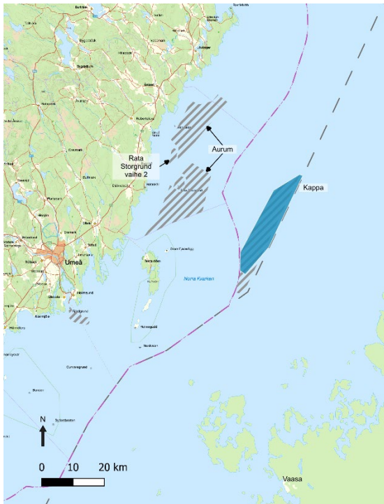
Kuva 2. Kappan läheisyydessä on useita muita tuulivoimahankkeita selvittävänä. Rata Storgrundin vaihe 2 ja Petlandskär eivät ole ajankohtaisia tai ovat peruuntuneita (Vindbrukskollenin mukaan). Kappan alapuolella oleva harmaa viivoitettu alue on Kappan entinen hankealue.