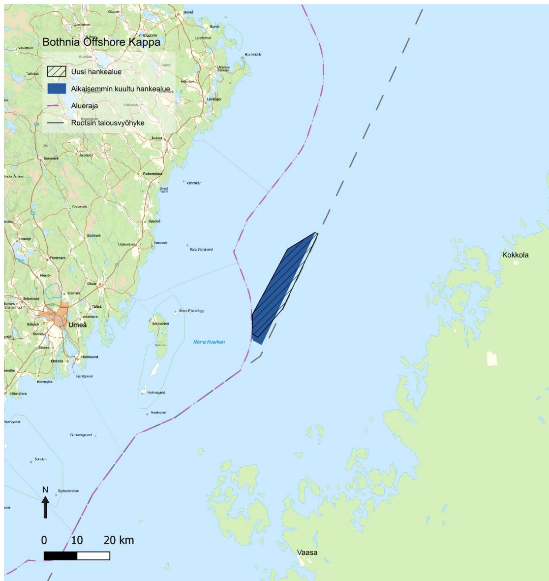
Kuva 1. Bothnia Offshore Kappa -tuulipuistoa kuultiin vuonna 2023. Kuulemisen jälkeen on tullut esiin tietoja, joiden perusteella hankealuetta on mukautettu pienentämällä sitä etelässä ja laajentamalla itään, minkä vuoksi on järjestettävä uusi kuuleminen.

Seuraavassa muistiossa selvitetään hankealueen jakamisesta ja laajentamisesta johtuvia muutoksia. Vuoden 2023 kuulemisasiakirja on liitteenä.