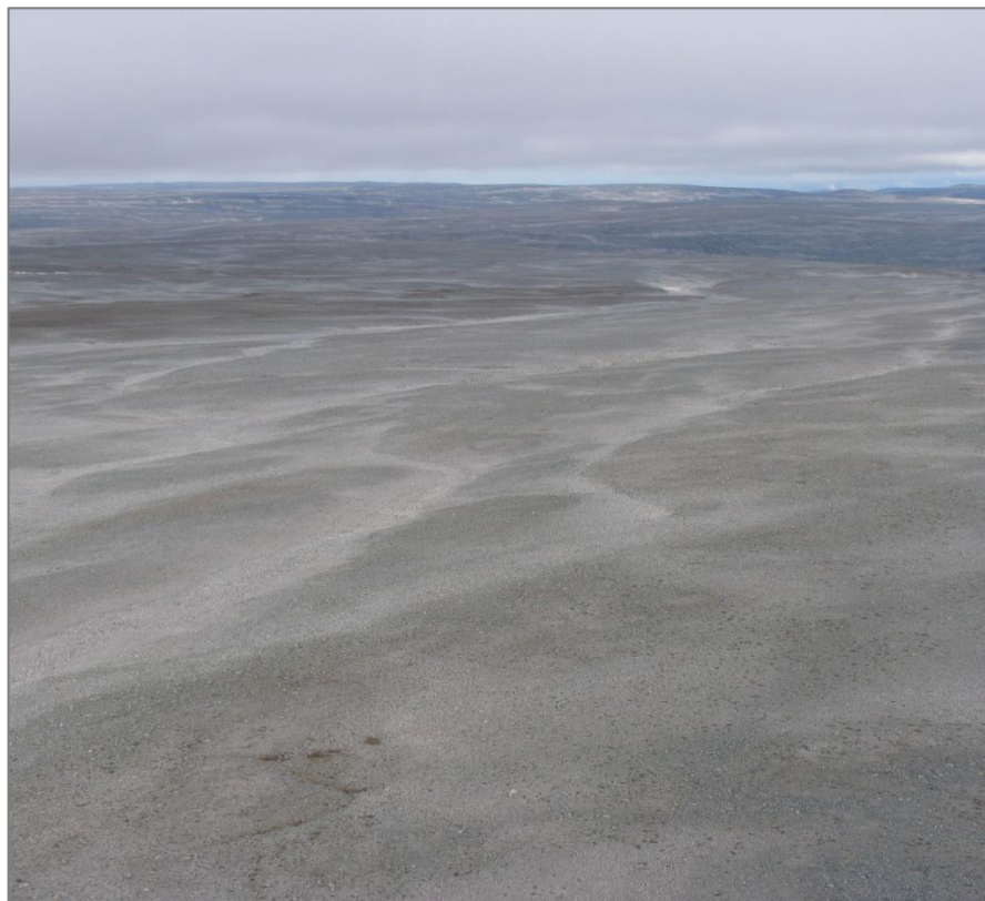
Govus 3. Davvi bieggapárkka plánaguovllus.

Beaivválaš jođiheaddji Geir Skoglund, e-poasta: geir.skoglund@vindkraftnord.no , tlf: 452 03 714.