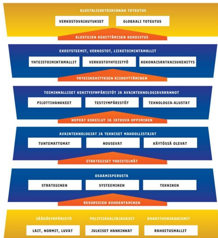
Kuva 5: Alustatalouden tiekartasto; alustatalouden edistämisen politiikkatasot

Suomen on parannettava kilpailukykyään sekä tuettava kokonaisvaltaisesti suomalaisten yritysten mahdollisuuksia nousta alustatalouden maailmanluokkaan. Tämä edellyttää monilla tasoilla tapahtuvaa ja monien toimijoiden toteuttamaa kehitystyötä. Kuvio x avaa tätä kokonaisuutta. Tärkeänä osana kokonaisuutta ovat avainteknologiat ja tekniset mahdollistajat, joista erityisesti tekoäly voi parantaa Suomen kilpailuasemia. Lähivuosien tekninen kehitys tarjoaa laajemminkin mahdollisuuksia suomalaisille yrityksille, mutta näiden mahdollisuuksien realisoituminen edellyttää ennen kaikkea innovatiivisuutta tietoteknisissä ratkaisuissa ja liiketoimintastrategioissa. Kilpailuedun hakeminen näiden yhdistelmistä on jatkuva haaste suomalaisyrityksille.