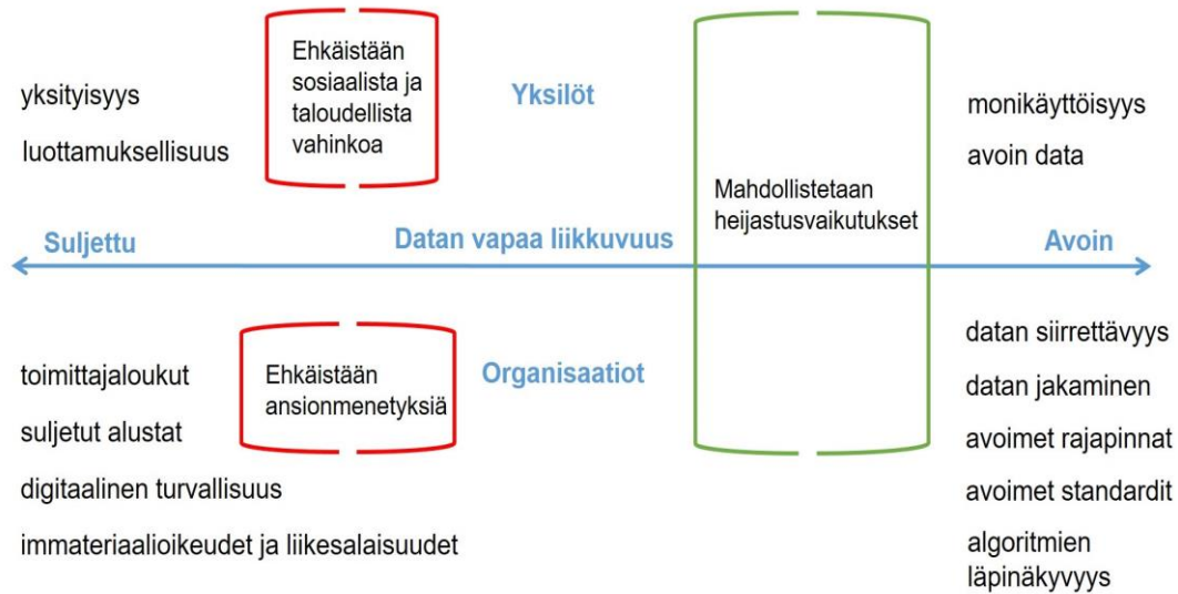
Kuva 2: Datan avoimuuden ja käytettävyyden näkökulmia. Lähde (mukaiillen): OECD